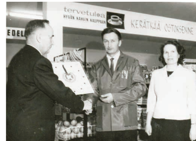
Keskon pääjohtaja luovuttaa lahjakellon Lehtosille Päijälän Valinnan avajaisissa.

Tämä artikkeli perustuu virallisiin asiakirjoihin, valokuviiin, omiin muistoihini ja ajatuksiini kaupan vaiheista.