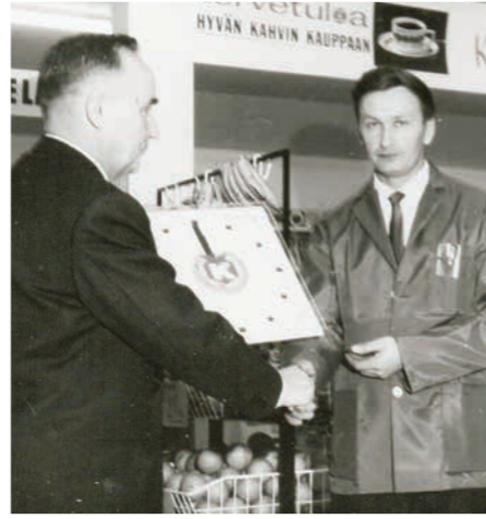
17 Valinnan historiaa

omine ajatuksinemme, haaveinemme, vaikeuksinemme, ..... ja odotuksinemme. Moninaisuus luo uutta, antakaamme tilaa myös uusille ajatuksille ja tulkaamme rohkeasti esiin niiden kanssa. Tätä nyt tarvitaan, kun Päijälässä ryhdytään miettimään kylän uutta kehittämisohjelmaa edellisen ”Elinvoimainen Päijälä 2015-25” ollessa lopuillaan - sen tavoitteet kohtuullisesti toteutuneina.