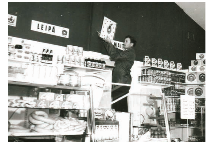
K-kaupan kello sijoitettiin paraatipaikalle palvelutiskin taakse.