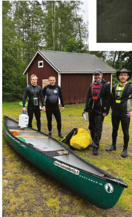
13 Melontareitti SUP-laudoilla