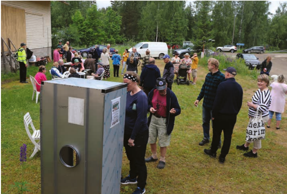
Muhkuloton äänestyskoppi ja yleisöä